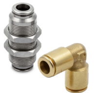
Rácores automáticos en latón sin plomo Serie F-E y F-NSF, tubos de \varnothing 4 a 10 mm, roscas de M5 a 1/2".