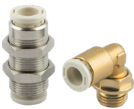
Rácores automáticos en latón sin plomo serie F-E PLUS y F-NSF PLUS, tubo de \varnothing 4 a 10 mm, rosca de M5 a 1/2".