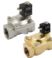
Electroválvulas servoasistidas de 2 vías, membrana, cuerpo de latón o acero inoxidable.