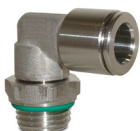
Rácores automáticos en acero inoxidable AISI 316, tubos de \varnothing 4 a 12 mm, roscas de M5 a 1/2".